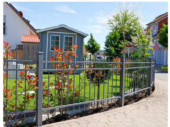
Zeitlos elegante Einzäunung von Gärten und Grundstücken.